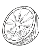
Грейпфрут Grapefruit 600 ₺