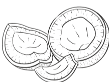
Кокос Coconut 500 ₺