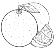
Апельсин Orange 500 ₺